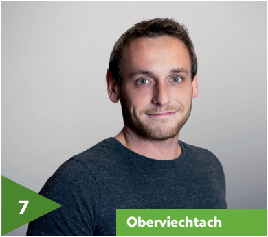
Christian Meller Polier Spezialtiefbau